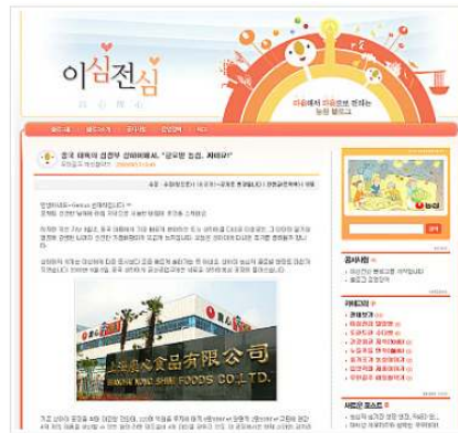
식품과 먹거리에 대한 정보 및 농심 임직원과 회사에 대한 이야기를 소비자와 함께 나누고 의견을 나누는 농심 기업 블로그 - 이심전심 blog.nongshim.com

얼마 전 오픈한 농심의 기업 블로그 ‘이심전심’은 블로그명의 의미처럼 고객과의 진정한 소통을 이루기 위해 새롭게 시작한 블로그로 농심 내부 임직원으로 구성된 11명의 필진 블로그가 실명과 사진을 공개하고 직접 블로그를 운영하면서 소비자의 소리를 가까이서 듣는 소셜 미디어 역할을 담당하고 있다는 측면에서 좋은 사례라 할 수 있다.