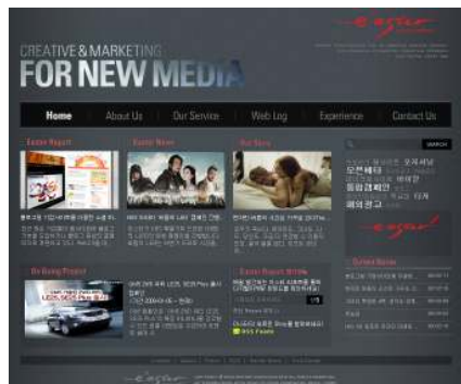
2.0 마케팅 캠페인을 지향하는 온라인 전문 광고회사 이스터 커뮤니케이션은 블로그의 문화와 환경을 이해하고 마케팅에 능동적으로 대처하기 위해 작년 자사의 홈페이지를 블로그형 사이트로 개편하였다. (2008.10) http://easter.co.kr

마지막으로 블로그는 웹사이트의 연장선상이 아니라 블로그 환경과 인간감성이라는 차원 두 가지를 만족해야 진정한 블로그라고 말할 수 있다. 기업이 운영하는 블로그의 성공 관건은 기업과 소비자간의 소통에 대한 ‘진정성’과 ‘양질의 콘텐츠’ 확보 여부다. 블로그를 어떤 방식으로 활용할까 생각하기 이전에 블로거와 어떻게 효과적으로 상호 교감하고 소통하여 진정한 대화를 통한 브랜드에 대한 신뢰를 만들어 가는 원리를 먼저 깨달아야 하는 것이 필요하다.